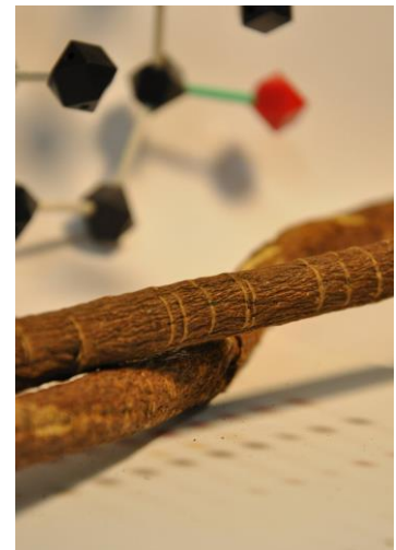
図1 甘草

マメ科カンゾウ（ Glycyrrhiza ）属のカンゾウはその地下部に砂糖の150倍以上とも言われる天然甘味成分グリチルリチンを蓄積することで知られています。また、グリチルリチンには抗炎症作用など薬理活性を有することから、それを蓄積するカンゾウの地下部を乾燥したものは生薬「甘草」として漢方など、洋の東