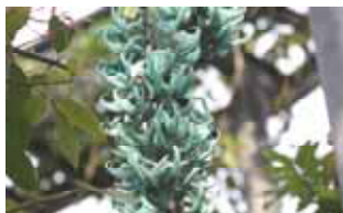
ヒスイカズラ 【絶滅危惧種】