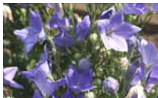
キキョウ 【絶滅危惧種】

常磐植物化学研究所は、東京都薬用植物園の薬用植物保護活動を応援しています。四季折々の薬用植物をホームページ（ http://www.tokiwapph.co.jp/club/cat7/ ）で紹介しています。バジル、カモミール、エキナケアなどの身近なハーブから、普段は決して目にすることはできないケシや絶滅危惧植物まで、様々な薬用植物の写真を楽しめます。四季折々の植物からの便りをご覧ください。実際の植物たちに会いに、東京都薬用植物園（東京都小平市）まで、ぜひ足を運んでみてください。