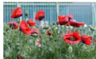
ハカマオニゲシ 【麻薬原料植物・栽培禁止】