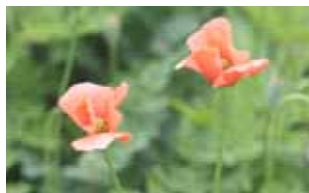
ナガミヒナゲシ 【ケシ科】